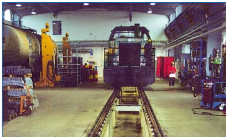
Ferrocarril / Ferrocarril regional